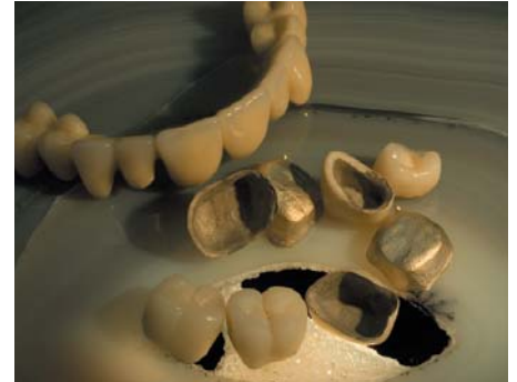
C. Hafner: Orplid 21