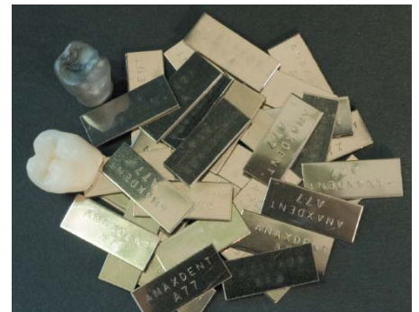
Anaxdent: A 77